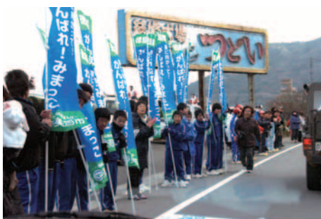
▲地元選手を応援する岩倉中学校の皆さん

この結果は1年を通して厳しい練習を繰り返した選手の精進はもとより、合宿などでご協力いただいた地域や保護者の皆様、そして沿道で温かくご声援いただいた市民の皆さんのおかげと選手・関係者一同感謝しています。