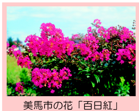
美馬市の花「百日紅」