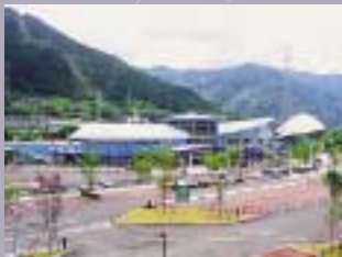
【吉野川ハイウェイオアシス】

美馬市から足を延ばせば、県内には魅力あふれる観光スポットが点在しています。祖谷の「かずら橋」は、日本三大奇橋のひとつ。長さ45mの橋はとてスリリング。世界三大潮流のひとつ「鳴門渦潮」は、激しい潮流が轟音をあげて渦巻き、変化する様は壮観です。徳島市の「眉山」は映画にもなり、観光のシンボルです。吉野川ハイウェイオアシスは全国でも数少ない川に直接触れることのできるサービスエリアです。奇岩・怪岩で知られる「大歩危・小歩危」は、壮大な渓谷が楽しめます。阿波の「土柱」は、段丘礫層が、雨風に侵食されたもので世界三大土柱のひとつ。