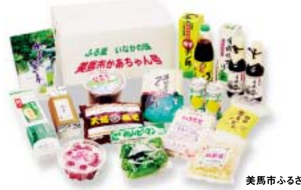
美馬市ふるさと小包

みまから うどんやそば、鍋料理にピリッと辛味を効かす、その名のとおり美馬で誕生した辛党に大絶賛の薬味。無農薬栽培の青唐辛子を佃煮風にしたもの。