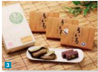
3 川田光栄堂 TEL:0883-53-7878