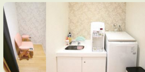
美馬市子育て支援センターみらい