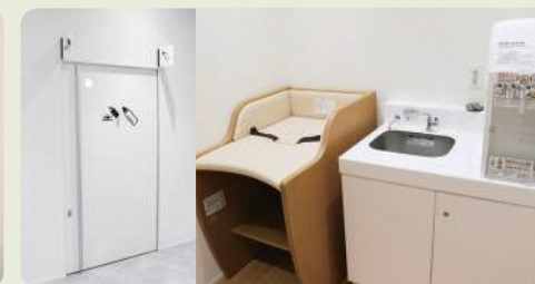
美馬市地域交流センターミライズ