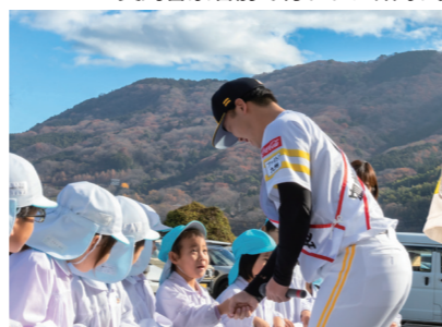
園児たちから「大きい」「カッコいい」と歓声が

明るく、新しいニューズで 新年の幕開けができて嬉しいなあ この後のページも見逃さないぞ