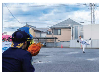
美馬警察署前で行われた始球式