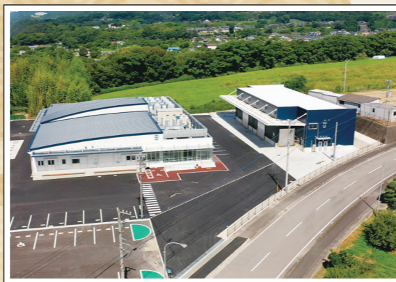
学校給食センターと総合防災倉庫（脇町小星地区）

一方、市長就任時に重点施策として掲げさせていただいた「デジタル地域通貨 MIMACA の普及」につきましては市民の皆様にご浸透してきており、「中学校の部活動支援」や「耕作放棄地対策」につきましても、それぞれ市独自の対策をスタートさせることができました。