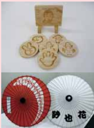
※写真はイメージ図です。