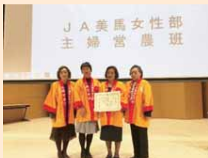
▲記念撮影の様子（JA美馬女性部主婦営農班）

11月8日、徳島市で第5回とくしま集落再生表彰の表彰式が行われ、JA美馬女性部主婦営農班が最優秀賞を受賞されました。 家庭菜園で栽培した野菜を「かあちゃん野菜」として阪急百貨店に出荷するなど、これまでの創意工夫をこらした集落再生の実現に向けた取り組みが評価されました。