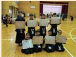
協町少年剣道教室