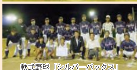
軟式野球「シルバーボックス」