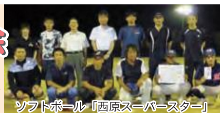
ソフトボール「西原スーパースター」