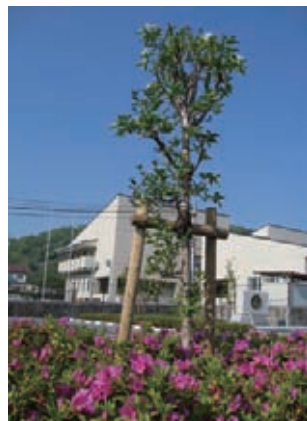
美馬市役所のヒトツバタゴ

近畿美馬市ふるさと会が、道の駅「藍ランドうだつ」に記念植樹をした「ヒトツバタゴ（通称ナンジャモンジャノキ）」が今年も純白の花を咲かせました。 ヒトツバタゴは、国の天然記念物に指定され、環境省レッドデータブックで絶滅危惧Ⅱ類に指定されている非常に珍しく、全国にもあまり分布していない樹木です。