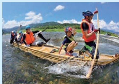
▲第29回大会写真コンテスト グランプリ作品「がんばるぞー」