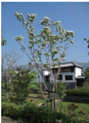
道の駅藍ランドうだつのヒトツバタゴ