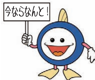
下水道マスコットキャラクター 「スイスイ」

2 カ月あたりの算定使用水量のうち、基本使用水量 (20 m 3 ) を超える水量について 50% 減量し、使用料を減額いたします。