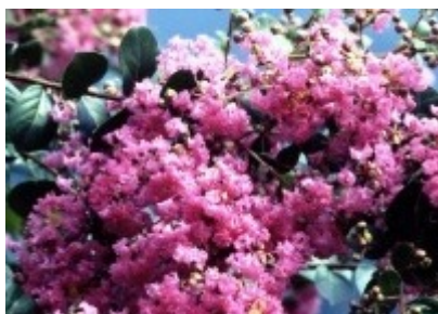
市の花「百日紅」(サルスベリ)

実施計画は、平成19年度から平成21年度までの3年間を計画期間としており、毎年度更新いたします。この期間における施策の達成目標を掲げることで、今後の教育行政の効率的な推進をめざすものです。