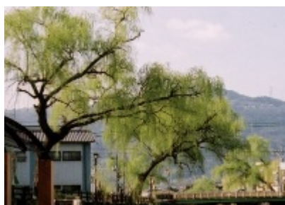
市の木「柳」(シダレヤナギ)