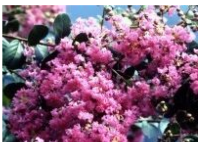
市の花「百日紅」(サルスベリ)

実施計画は「美馬市教育振興計画」の第1期基本計画（平成19年度～23年度）の計画目標達成に向けた施策の方策を示すものです。