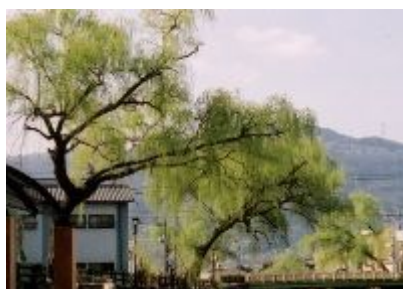
市の木「柳」(シダレヤナギ)