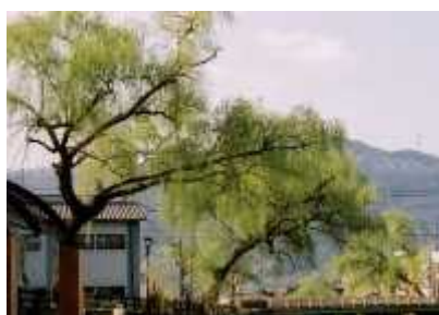
市の木「柳」(シダレヤナギ)