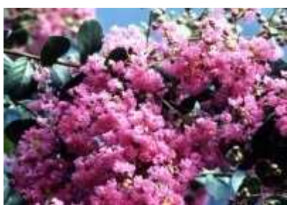
市の花「百日紅」(サルスベリ)

実施計画は「美馬市教育振興計画」の第1期基本計画（平成19年度～23年度）の計画目標達成に向けた施策の方策を示すものです。