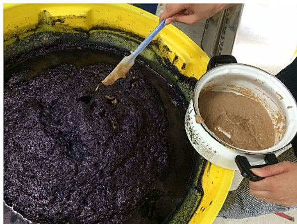
phや藍の状態をみながら ふすまや石灰を入れ攪拌