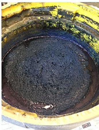
3, 4日目 攪拌は毎日行う