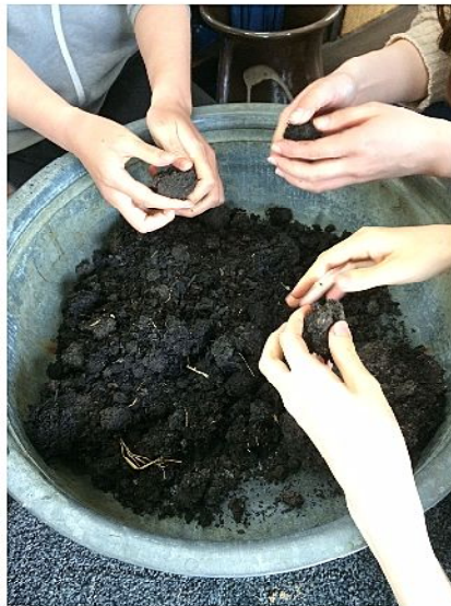
すくも(タデ藍を堆肥状にしたもの)塊をつぶす