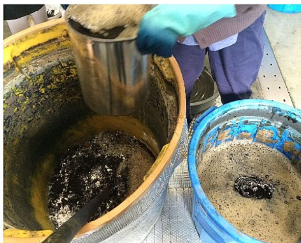
木灰をお湯で漉した灰汁を入れ、攪拌