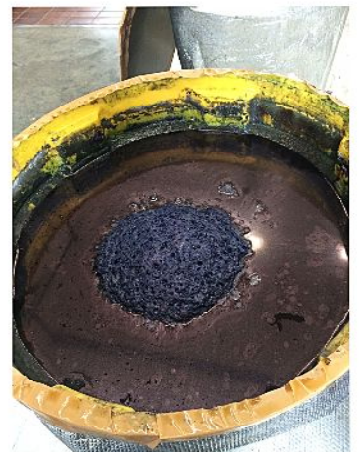
10日ほど調整しながら 発酵させ染めることができる