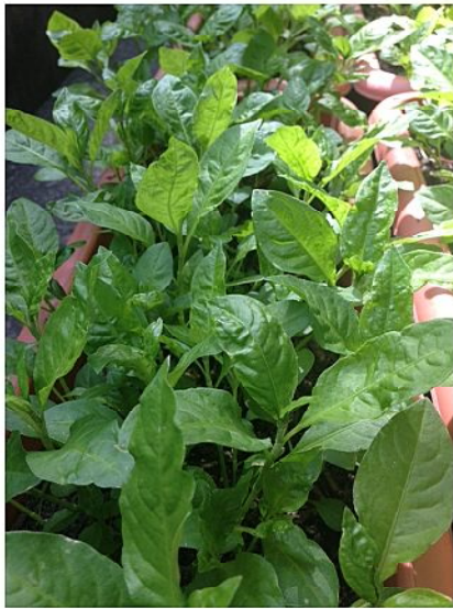
タデ藍：タデ科の植物