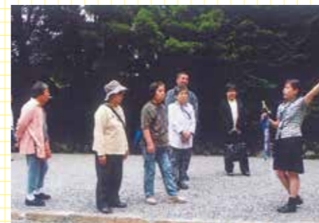
独自に企画したツアーも大人気。