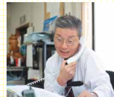
あらゆる移動のニーズに応える。