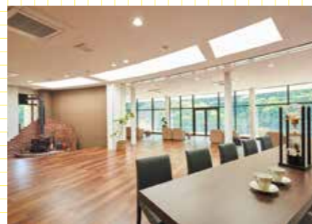
広々としたエントランスホールからバルコニーに出ると清流穴吹川が見下ろせる。