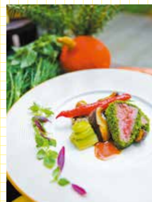
繊細で美しい料理は、ゲストからの評価も高い。季節の食材を料理長自ら市場で買い付けている。

脇町の小高い丘に建つ人気の結婚式場ディスティーノ。夢のような幸せの一日を演出するのは、NYスタイルの会場と緑あふれるナチュラルガーデン、そして、スタッフの心を込めたサービス。メモリアルな一日が主役と来場者の心に生涯残る財産となるように、プランナー、サービススタッフ、調理スタッフが一丸となって、一組一組の結婚式に全力を尽くす。