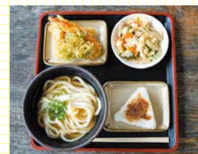
その日の気分好きなものを好きなだけ。

家族に出すのと同じように愛情を込めて作るのも「和あさん」流のこだわり。その味を求めて年配の人が晩ご飯にと持ち帰りをしたり、休日の子どもたちが昼食を食べに来たりもする。昨今問題になっている「孤食」や「食の格差」を解消し、お腹を満たした元気な笑顔の和が地域に広がることを新たな目標に加え、スタッフ一丸となって奮闘している。