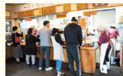
昼時ともなれば多くの来店客で店内が賑わう。