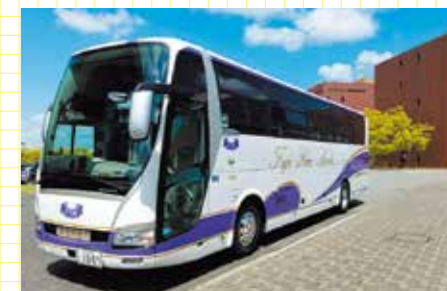
安全・安心・快適なバスの旅を提供。

平成13年の創業以来、貸切バス事業一筋を買ってきた藤西阿観光株式会社。学校や町内会単位の団体から、少人数でのグループ旅行や四国八十八カ所巡り、部活動の送迎など、定員53名の大型バスをはじめ所有する10台のバスを駆使してあらゆる移動のニーズに応え続ける企業だ。地元の道を知り抜いた地域密着のバス会社として旅行会社からも厚い信頼を得ており、その期待に応えるために日頃から安全点検を行ない、運行前には運転手のコンディションもチェックを欠かさないことで、公益社団法人日本バス協会によるセーフティバスマークの認定を取得。独自に企画したツアーも、季節ごとに選りすぐりの美味しい料理や美しい景色で楽しませてくれると大人気だ。