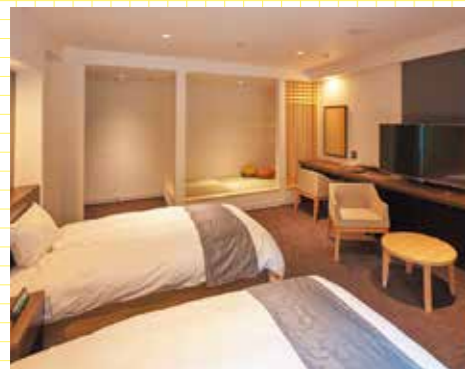
3室あった部屋を滞在型の特別室(全2室)にリニューアル。

「こんな奥地までよう来てくださった、そんな感謝の気持ちを胸に笑顔でもてなすスタッフも印象的。」