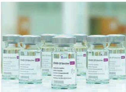
新型コロナウイルスワクチン(イメージ図)

問 新型コロナウイルスワクチン4回目の接種状況について、市内対象者及び、高齢者等施設の接種状況は。