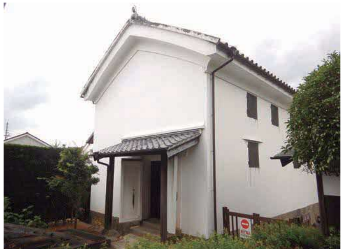
歴史資料館として整備予定の吉田家住宅質蔵

答 企画総務部長 新電力撤退による実質的な影響額は、550万円あまりとなっておりませんが、ウエスト電力からは、違約金約480万円と和解金約850万円が得られますので、いわゆる損失につきましては発生しないものと認識しております。