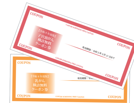
子宮頸がん・乳がん検診無料クーポン券(イメージ)

子宮頸がん検診:平成13年4月2日~平成14年4月1日生まれの方 乳がん検診:昭和56年4月2日~昭和57年4月1日生まれの方