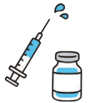
秋開始接種イメージ図

65歳以上の方等(春に接種券をお送りした方)で春接種を受けなかった方には秋接種のお知らせをお送りしています。春接種を受けた方には3か月以上の間隔を空けて接種券を送付します。19歳以上64歳以下の対象者には9月に接種券を送付しています。12歳から18歳(高校3年生相当)までの方については、接種券の発行申請が必要です。詳しくは送付しているコロナワクチン接種のお知らせをご覧ください。6か月から11歳の方については、新型コロナワクチン接種担当までお問い合わせください。