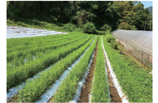
ミシマサイコほ場。2年間栽培し、収穫した根を乾燥させて、漢方薬の原料として出荷します。