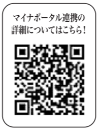
マイナポータル連携の 詳細についてはこちら!

★マイナポータル連携により控除証明書等のデータを取得するには、控除証明書の発行主体が、マイナンバー連携に対応していることが必要です。