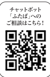
チャットボット「ふたば」への ご相談はこちら!

質問したいことをメニューから選択するか、自由に文字で入力いただくとAIが自動回答します。