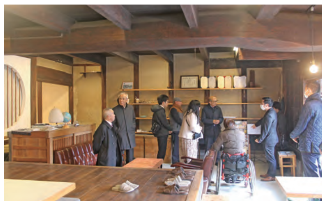
長与町議会からの視察