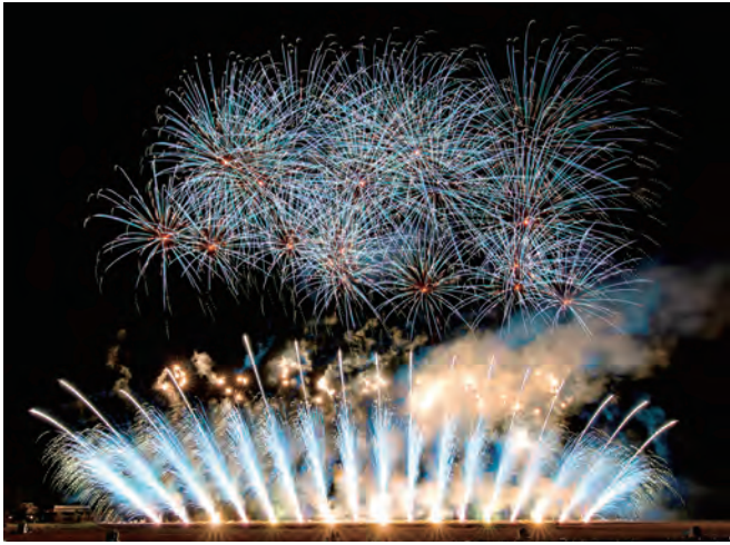
第2回にし阿波の花火大会

実行委員会に支援団体として参画、関係機関との調整、職員をスタッフとして派遣しました。