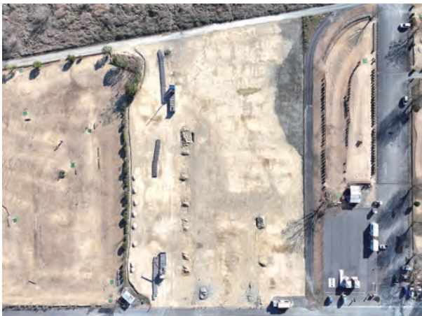
造成工事が完成した西部健康防災公園(竹林跡地)

空き家の除却と利用可能な空き家の活用を両面から進めているところです。 そこで空き家の所有者に対し、本市の空き家バンクによる、「空き家巡回管理サービス」の活用を推進し、今後とも積極的に取り組めます。