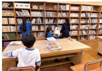
美馬市内の廃校施設にある図書