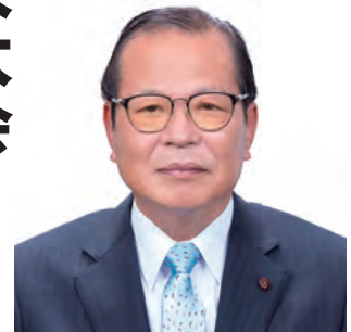
田中 義美 議員