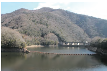
流木等撤去後の夏子ダム