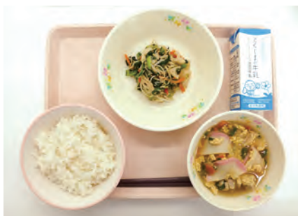
美馬市産米を使用した給食