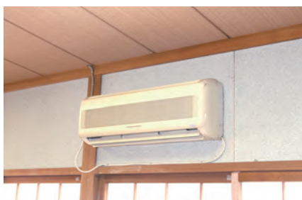
更新予定の集会所空調設備