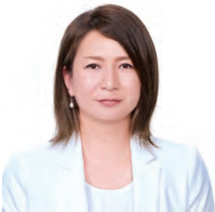
南 渚 議員