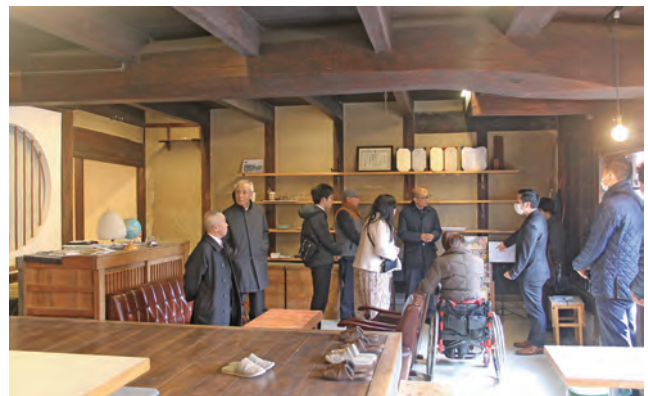
長与町議会からの視察