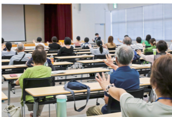
昨年度開催した講座の様子

あなたも認知症サポーターになりませんか? 認知症サポーターは、認知症に対する正しい理解を深めることで、認知症やその家族の方を温かく見守り、声かけやちょっとした手助けができる地域の「応援者」です。