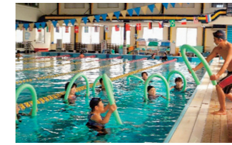
水中運動（OKスポーツクラブ協町）

【対象者】 65歳以上で、介護保険や総合事業のサービスを利用していない美馬市に住民登録されている方