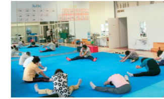
転倒予防・筋力アップ体操（アクア）

【申込方法】 参加を希望される方は 5月31日（金）まで にご連絡ください。後日、必要書類を長寿・障がい福祉課から送付します。