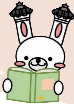
美馬市立図書館 マスコットキャラクター うだびよん

図書館内の展示物は開館時間内のみ観覧できます。費用の記載がないイベントの参加費等は無料です。おはなし会、編み物サロン・将棋サロン、出張図書館等の日程は市民カレンダーに掲載しています。詳しくは図書館の公式ホームページ等をご覧ください。