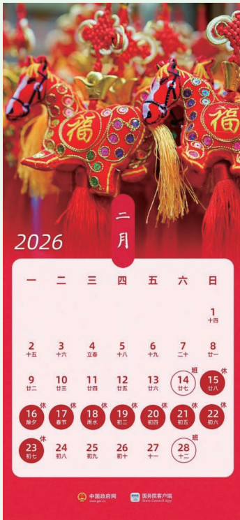
▲中国の2月のカレンダー

日本では、祝日を繋げた三連休を多く見受けませんが、中国の祝日は日本より少なく、新暦と旧暦で成り立っています。中国では、新暦の元旦、労働節、国慶節、旧暦の春節（しゅんせつ）、端午節、中秋節と二十四節気の清明節が祝日にあたります。