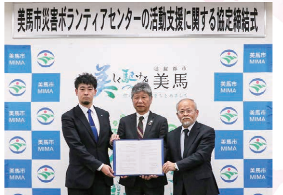
▲災害ボランティアセンターの活動支援に関する協定締結の様子

令和7年11月に、株式会社瀬戸内ブランドコーポレーションとともに、「うだつの町並み周辺におけるエリアマネジメントの推進に関する連携協定」を締結しました。この協定に基づき、株式会社風土