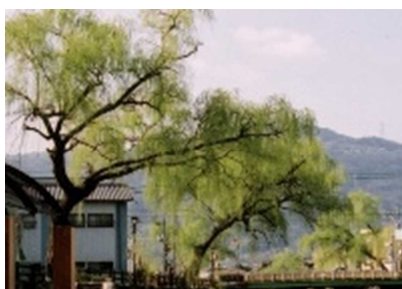
市の木「柳」(シダレヤナギ)