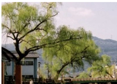
市の木「柳」(シダレヤナギ)