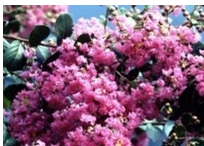
市の花「百日紅」(サルスベリ)

実施計画は「美馬市教育振興計画」の第2期基本計画（平成24年度～28年度）の計画目標達成に向けた施策の方策を示すものです。