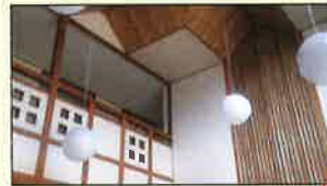
フロントは開放的な吹き抜けをモダンにアレンジ