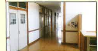
フロントから廊下に続く場所は懐かしい学校の面影が残る