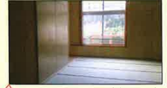
窓から見えるのは自然の景色 楽しい雑魚寝での宿泊♪