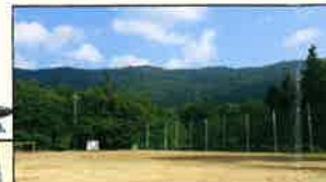
大自然に囲まれたグラウンドの遊びは自由！想像力を使ってあそぼう！