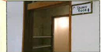
清潔なシャワーやトイレを新設 宿泊も安心