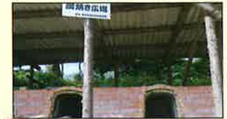
炭焼き広場で炭作りを体験 ピザ窯でピザ作り体験