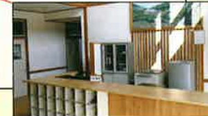
学校の入り口を入ったところに宿泊チェックをするフロント