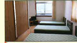
教室だった所を洋室の宿泊部屋に改装