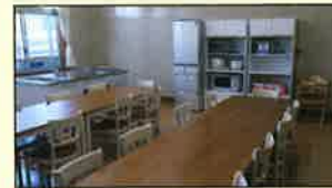
広々とした調理スペースで山菜料理やだんご作りを体験

校舎の1階に共同調理場を備え、2階の教室は洋間と和室に改装。入り口には「5年1組」と表示して、学校の雰囲気をもそのまま残しています。全体で6部屋あり、最大で18名まで宿泊できる。宿泊者向けの体験メニューとして、石窯を使ったピザ焼きや、うどんやそばの手打ちのほか、炭焼きや農作業、山林での作業なども用意しています。